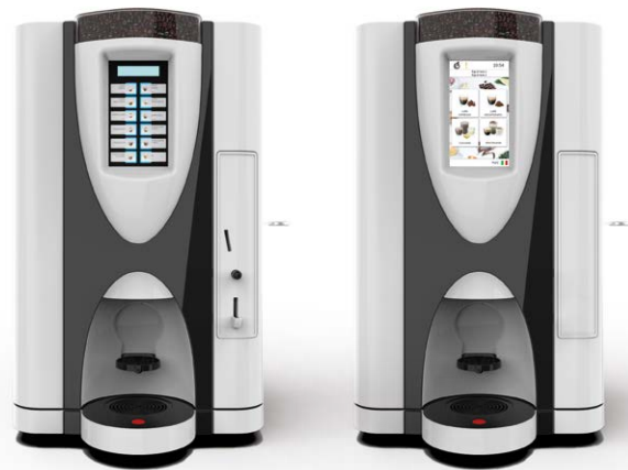
LEI SA RY EASY